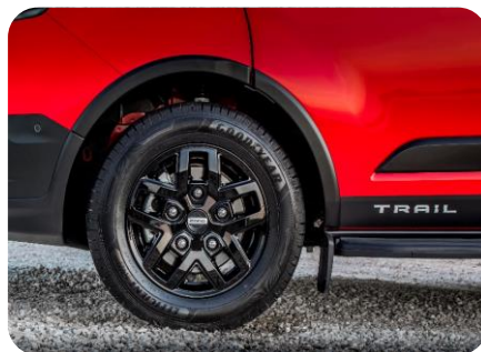
Verzia Trail (ilustračné foto)