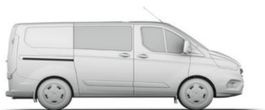
L1 H1 3,5 m 3

L1 = krátky rázvor, L2 = dlhý rázvor. H1 = nízka strecha, H2 = vysoká strecha. Všetky rozmery (uvedené v mm) podliehajú výrobným toleranciam, zahŕňajú minimálnu výbavu a neobsahujú žiadnu výbavu na pranie. *Výškové rozmery uvádzajú interval od minima po maximum nenaloženého a plne naloženého vozidla. Uvedené nákresy sú iba orientačné. Metóda VDA - objem určený tak, že sa nákladový priestor zaplní kvádrmi s objemom 1 liter a s rozmermi 200x100x50 mm. Kvádre sa potom spočítajú a výsledok sa prepočíta na m 3 . Metóda SAE - túto metódu používa organizácia Society of Automotive Engineers. Hodnota SAE sa určí spríemerovaním dvoch rozmerov výšky, dĺžky a šírky, ktoré sa vynásobia, aby sa odvodil objem v metroch kubických. Maximálny objem nákladového priestoru - spočíva v odmeraní objemu nákladového priestoru pomocou zmlieho materiálu ako je piesok alebo ryža, ktorým nákladový priestor naplní.