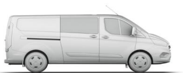
L2 H1 4,3 m 3