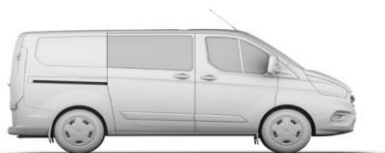
L1 H1 3,5 m 3

L1 = krátky rázvor, L2 = dlhý rázvor. H1 = nízka strecha, H2 = vysoká strecha. Všetky rozmery (uvedené v mm) podliehajú výrobným toleranciam, zahŕňajú minimálnu výbavu a neobsahujú žiadnu výbavu na pranie. *Výškové rozmery uvádzajú interval od minima po maximum nenaloženého a plne naloženého vozidla. Uvedené nákresy sú iba orientačné. Metóda VDA - objem určený tak, že sa nákladový priestor zaplní kvádrmi s objemom 1 liter a s rozmermi 200x100x50 mm. Kvádre sa potom spočítajú a výsledok sa prepočíta na m 3 . Metóda SAE - túto metódu používa organizácia Society of Automotive Engineers. Hodnota SAE sa určí spriemerovaním dvoch rozmerov výšky, dĺžky a šírky, ktoré sa vynásobia, aby sa odvodil objem v metroch kubických. Maximálny objem nákladového priestoru - spočítava odmeraním objemu nákladového priestoru pomocou zrnitého materiálu ako je piesok alebo ryža, ktorým na nákladový priestor naplní.